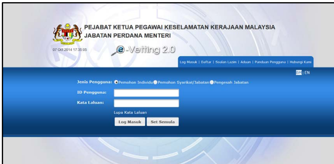
Gambarajah 4: Skrin Log Masuk

Langkah 01: Masukkan alamat pautan (URL) https://evetting.cgso.gov.my/cgso pada pelayar web dan skrin Log Masuk akan dipaparkan.